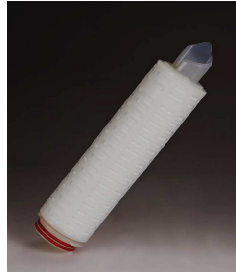
Beispiel eines Clever-T-flon VS Filterelements

Clever-T-flon VS Kerzenfilter passen hervorragend in so gut wie alle dafür bereits installierten Filtergehäuse anderer Hersteller